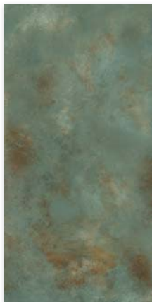
1620x3240 mm ♦ Laminam 12+